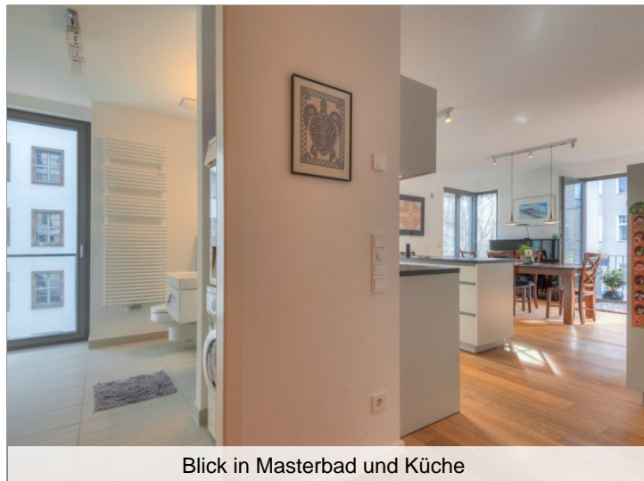
Blick in Masterbad und Küche