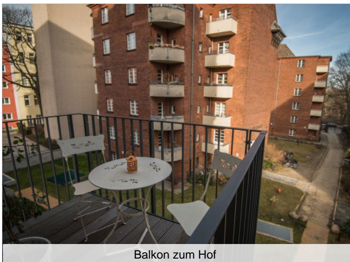
Balkon zum Hof