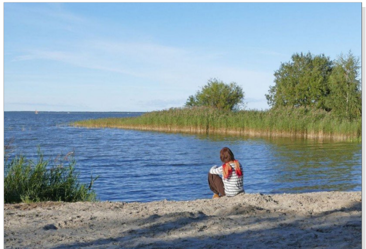
Entspannung am Bodden