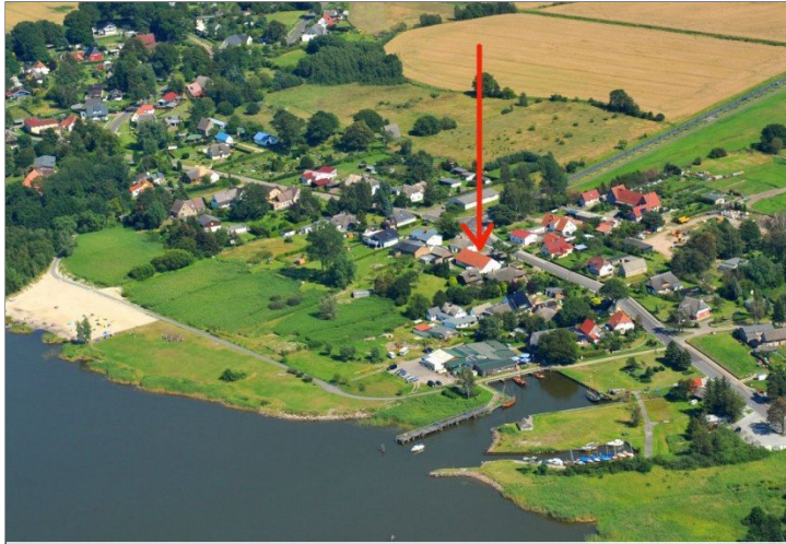
Luftbild mit Hafen und Boddenstrand