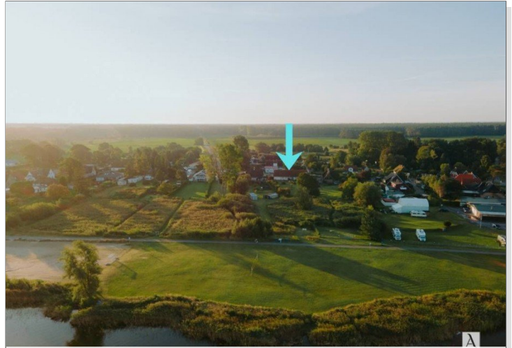
Luftaufnahmen mit Boddenstrand