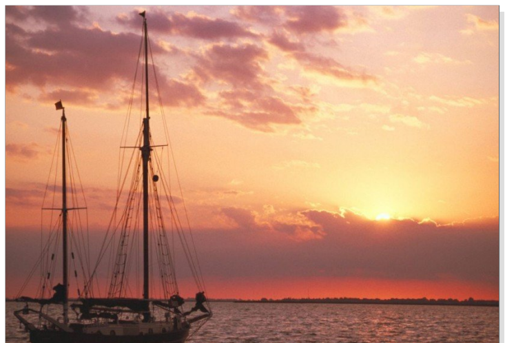
Zeesbootausflug auf dem Bodden