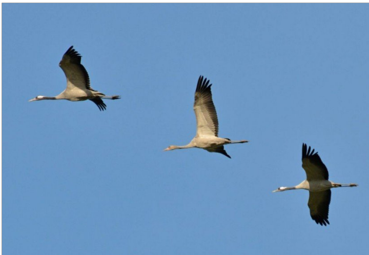
Kraniche über der Boddenperle