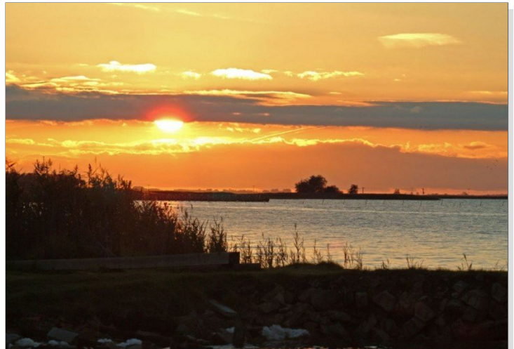
Sonnenuntergang am Bodden