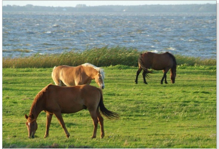
Pferde am Bodden