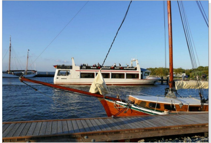
200m zum Hafen