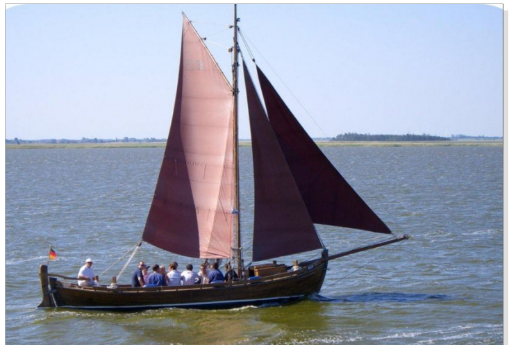
Zeesbootausflug auf dem Bodden