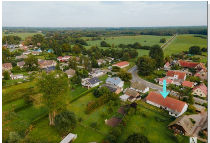
Luftaufnahmen mit Nachbarbebauung