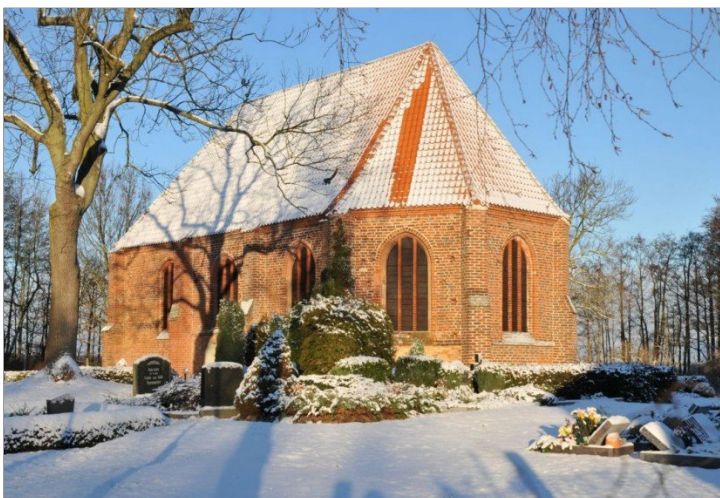
Kirche von Bodstedt