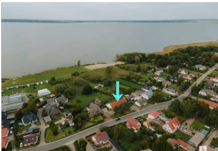
Luftaufnahmen mit Wasser-und Boddenstrand