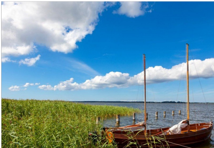
Ein. sonniger Tag auf dem Bodden